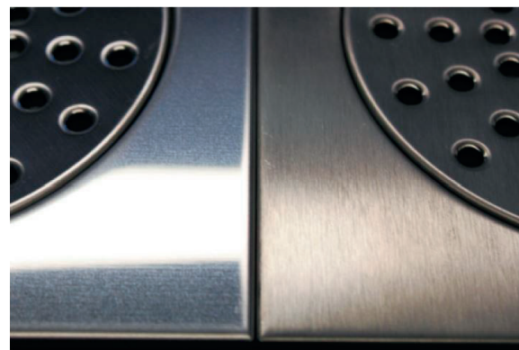
Kirkas / Matta